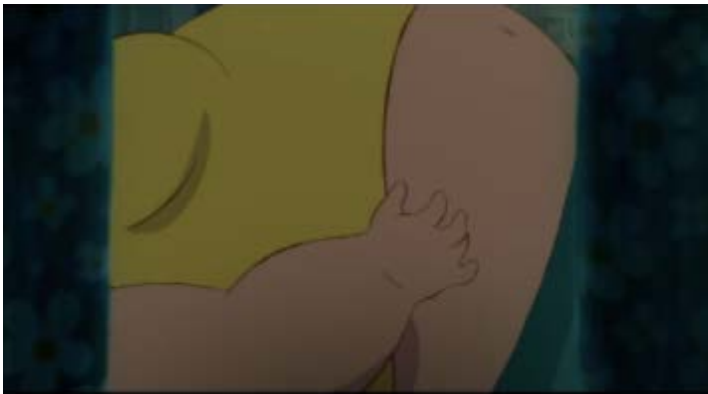
Nikuko en plein sommeil

"Dans cette scène j'ai essayé de rendre un peu plus familiers les éléments de fantaisie propres à Kikuko en les plaçant sous le signe du déjà-vu." nous explique Ayumu Watanabe