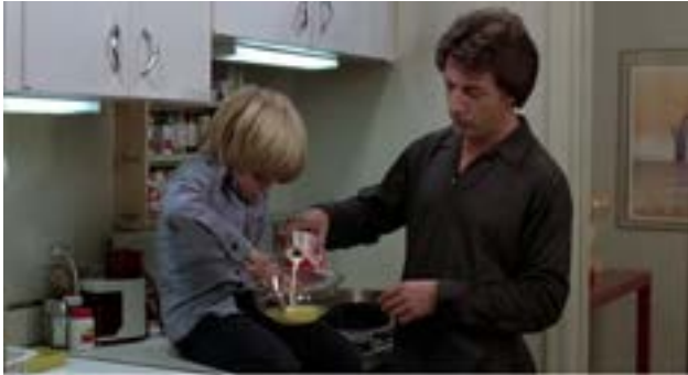
KRAMER CONTRE KRAMER de Robert Benton