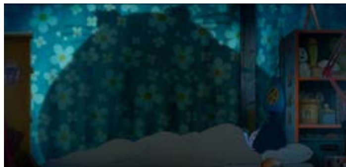
Kikurin rêve et l'ombre de sa mère se transforme en ombre de Totoro