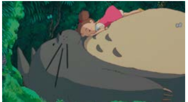
Totoro dort avec Mei