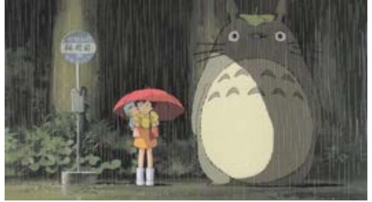
Mei, Satsuki et Totoro attendent le Chat-Bus