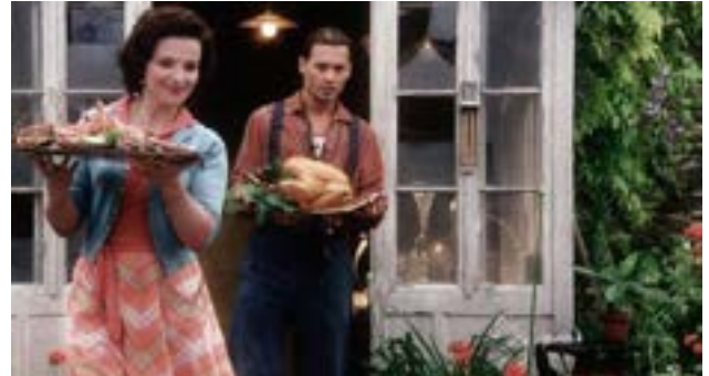
LE CHOCOLAT de Lasse Hallström