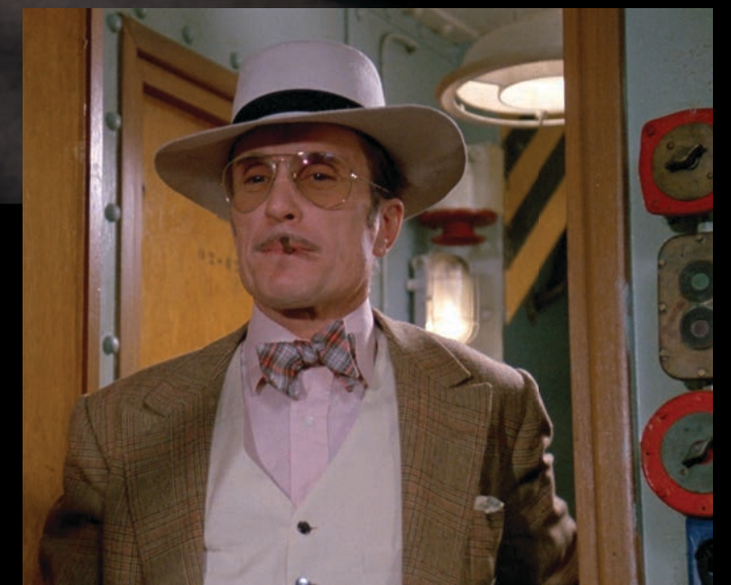
LE BATEAU PHARE