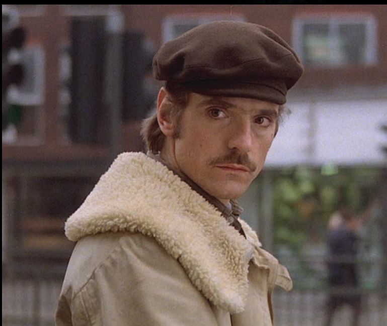
TRAVAIL AU NOIR