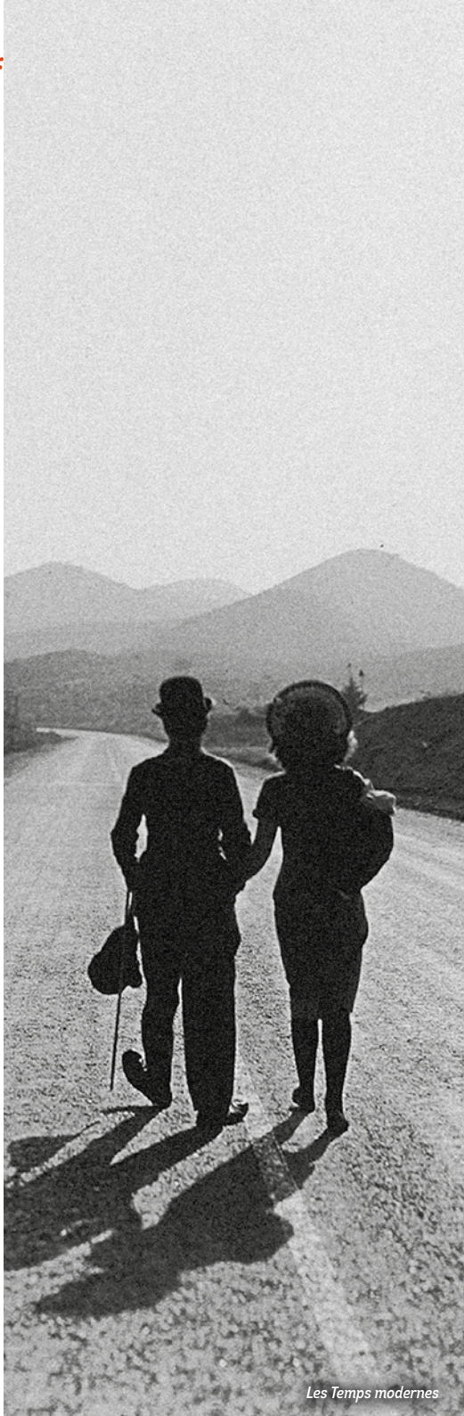
Les Temps modernes

Charlot découvre le travail à la chaîne. Avec l'âge adulte, la rêverie cède la place à un tête- à-tête avec le monde. Et, pour la première fois, une femme part sur les routes avec le vagabond. Un chef- d'œuvre intemporel. Télérama