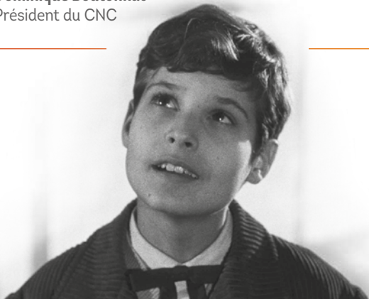
La Première nuit de Georges Franju. Une restauration Argos Films avec le soutien du CNC

L' Agence pour le Développement Régional du Cinéma (ADRC) est heureuse, pour la deuxième année consécutive, d'organiser le Festival Play It Again ! créé en 2015 par l'Association des Distributeurs de Films de Patrimoine (ADFP).