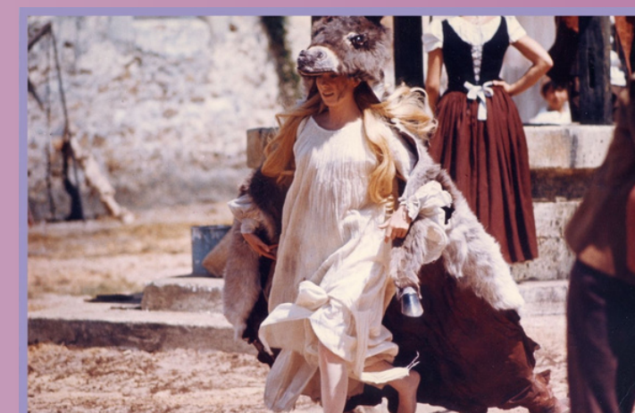
PEAU D'ÂNE de Jacques Demy