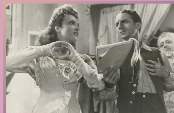
FÉLICIE NANTEUIL de Marc Allégret