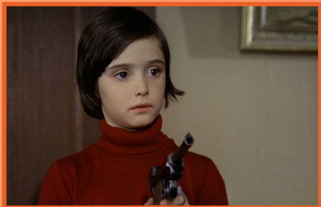
CRÍA CUERVOS de Carlos Saura