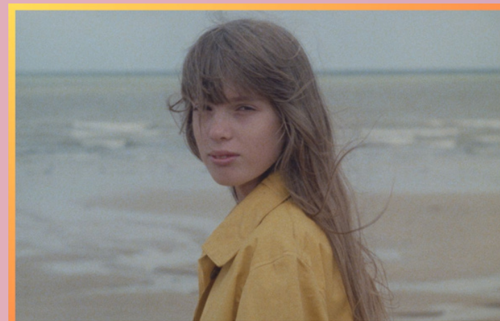
DIABOLO MENTHE de Diane Kurys