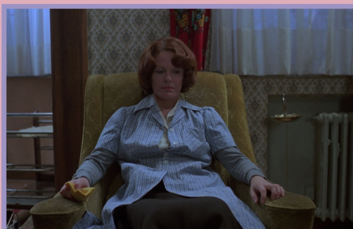
JEANNE DIELMAN, 23 QUAI DU COMMERCE, 1080 BRUXELLES de Chantal Akerman