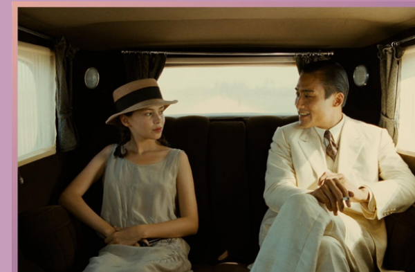
L'AMANT de Jean-Jacques Annaud