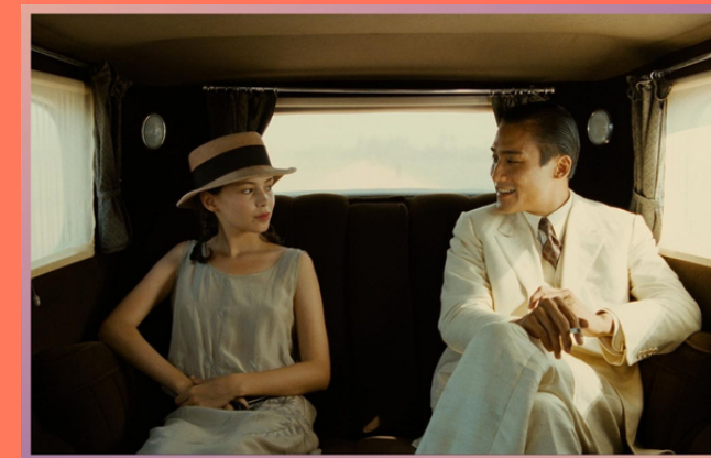
L'AMANT de Jean-Jacques Annaud