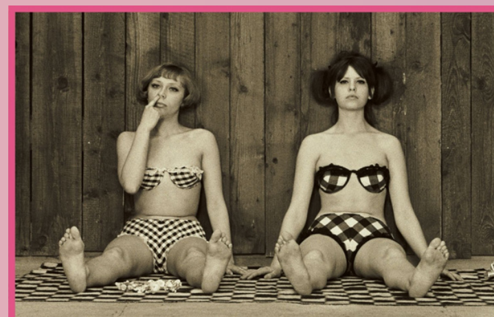
LES PETITES MARGUERITES de Věra Chytilová