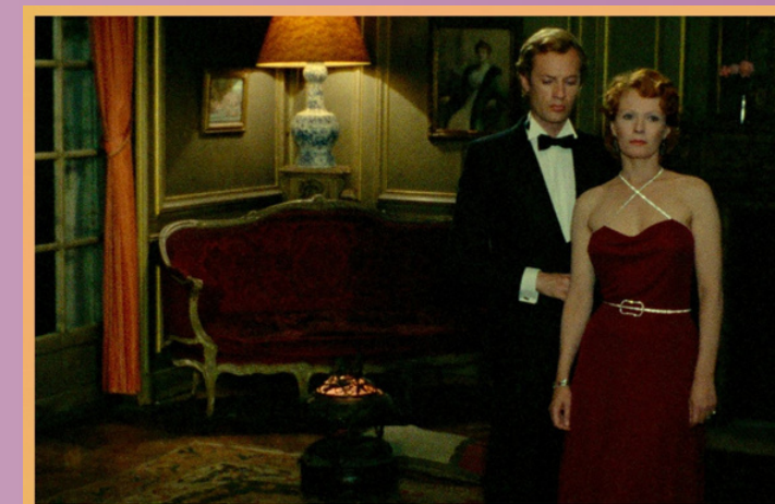
INDIA SONG de Marguerite Duras