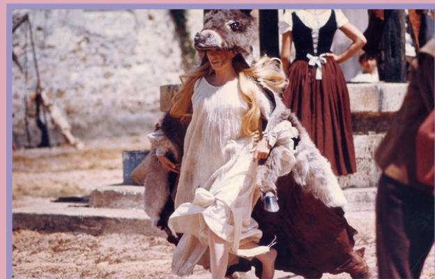
PEAU D'ÂNE de Jacques Demy