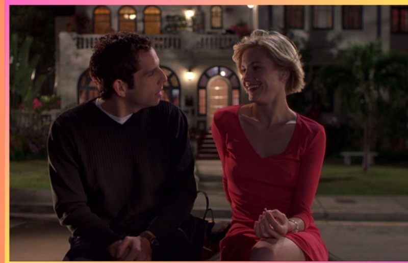
MARY À TOUT PRIX de Bobby Farrelly et Peter Farrelly