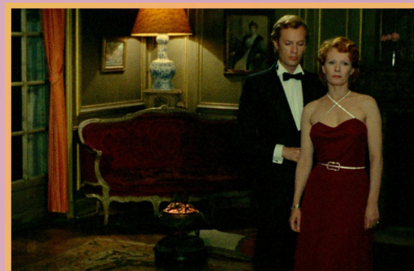
INDIA SONG de Marguerite Duras