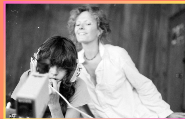
SOIS BELLE ET TAIS-TOI ! de Delphine Seyrig