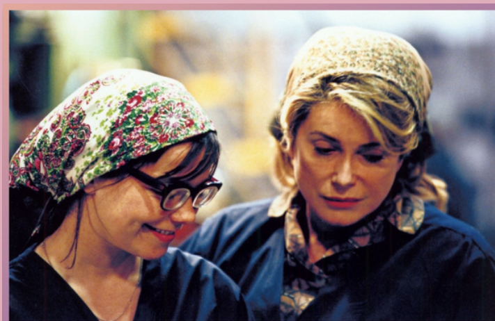
DANGER IN THE DARK de Lars Von Trier