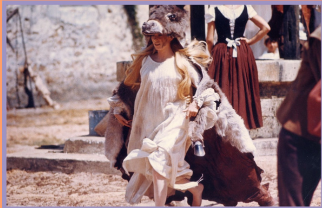
PEAU D'ÂNE de Jacques Demy