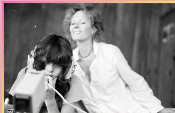
SOIS BELLE ET TAIS-TOI ! de Delphine Seyrig