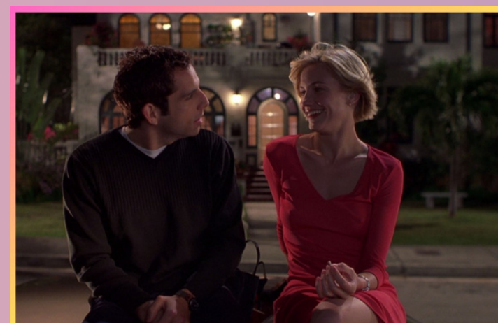
MARY À TOUT PRIX de Bobby Farrelly et Peter Farrelly