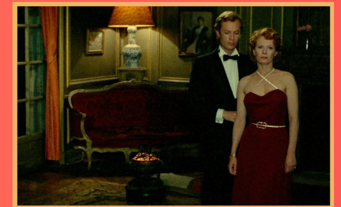
INDIA SONG de Marguerite Duras