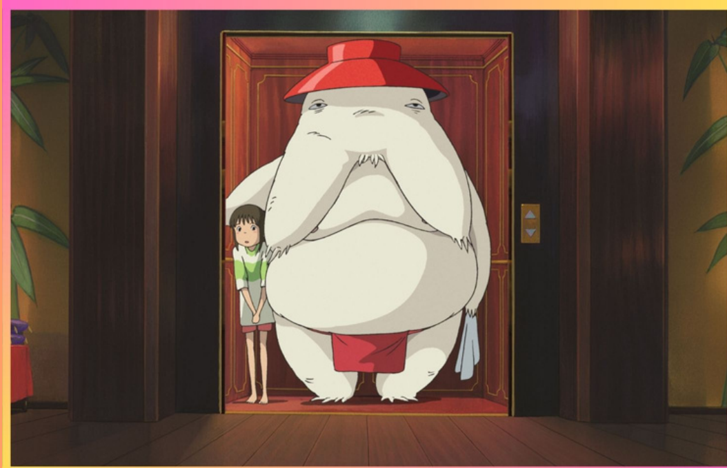
LE VOYAGE DE CHIHIRO de Hayao Miyazaki

L'association Femmes & Cinéma s'associe avec l'ADRC pour proposer un ensemble d' animations/ ateliers/ présentations de films ludiques et participatives couvrant une large part de la sélection.