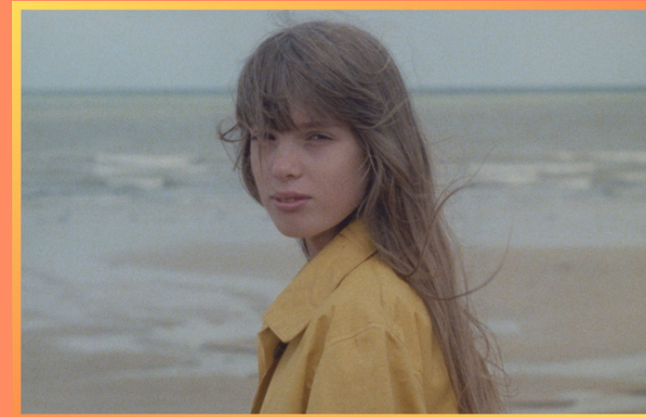
DIABOLO MENTHE de Diane Kurys