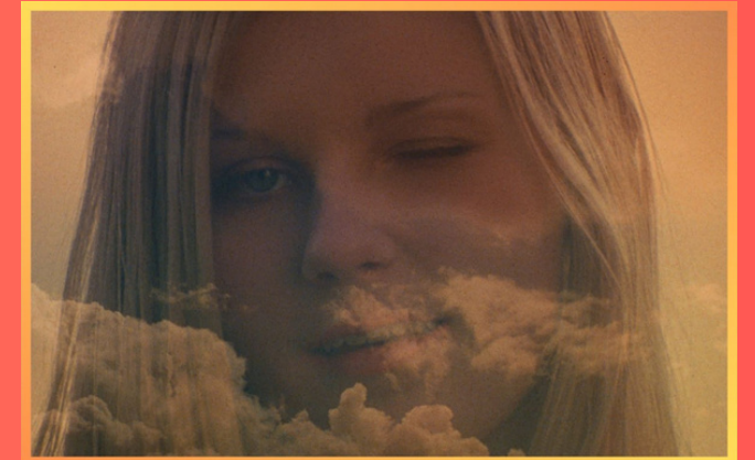
VIRGIN SUICIDES de Sofia Coppola