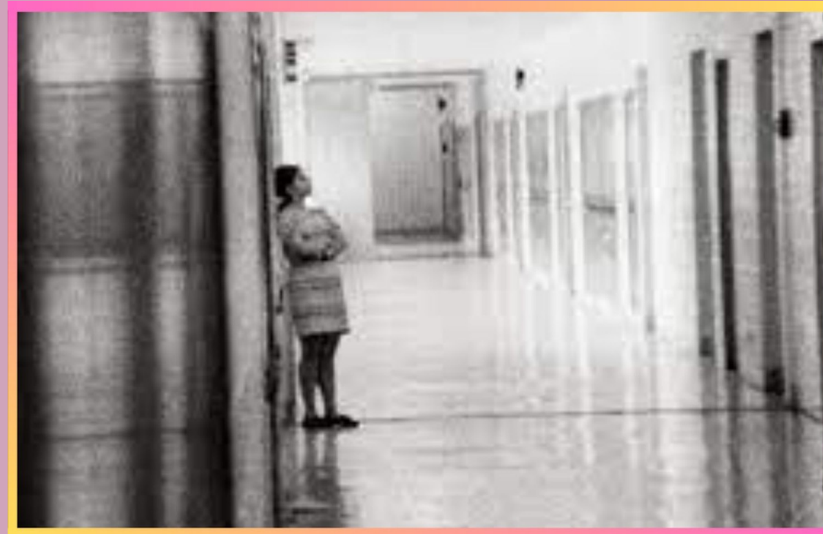
HIGH SCHOOL de Frederick Wiseman